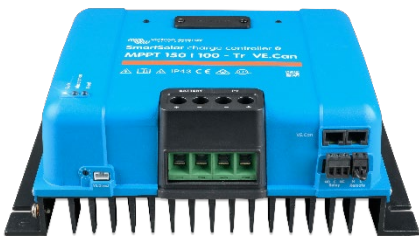
Controlador de carga SmartSolar MPPT 150/100-Tr-VE.Can sin pantalla