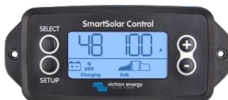
Pantalla conectable SmartSolar

Simplemente retire el protector de goma del enchufe de la parte frontal del controlador y conecte la pantalla.