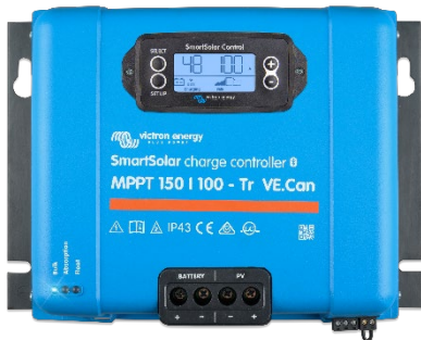
Controlador de carga SmartSolar MPPT 150/100-Tr-VE.Can con pantalla conectable opcional