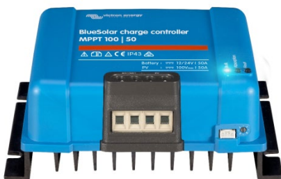
Controlador de carga solar MPPT 100/50